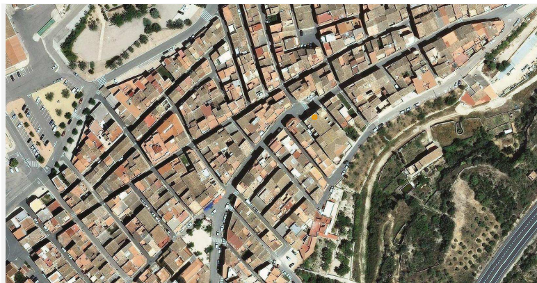
Ortofotomapa 1:2.500. ICC

Situació: L'entrada es troba a la plaça de l'Església.