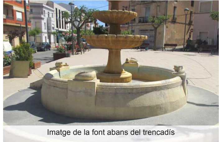
Imatge de la font abans del trencadís

El dia 18 de juny els carrers del Perelló van guarnir-se amb molts colors, dibuixos i formes per acollir una nova diada del Corpus. S'agraeix la participació de tots els veïns que ho fan possible!!