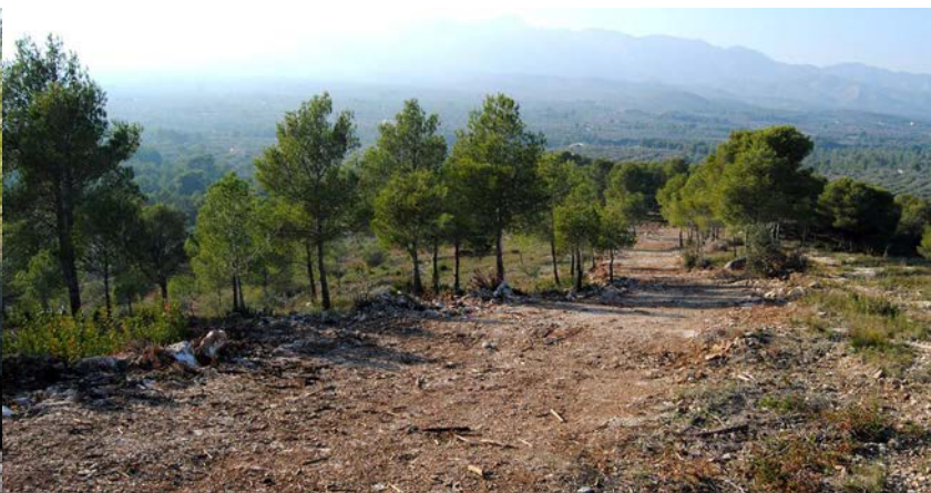
Camí Mas d'En Curto

Obertura de línia de defensa contra incendis forestals amb eliminació de restes in situ de 3,07 ha al paratge de CabraFeixet.