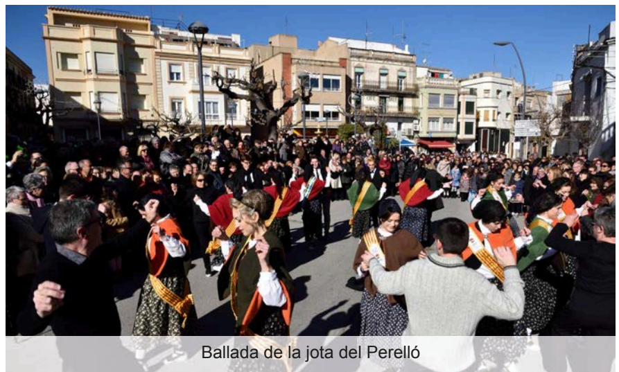
Ballada de la jota del Perelló

Una de les novetats de la nostra festa major va ser la ballada de la jota del Perelló a càrrec de les damiselles, pubilla i quintos, el dia del nostre patró, Sant Antoni. Mesos abans, van assajar-la amb el mestre Maso Queralt i el grup de jotes del Perelló. Aquest acte tradicional es vol mantenir amb les diferents quintes que vagin venint.