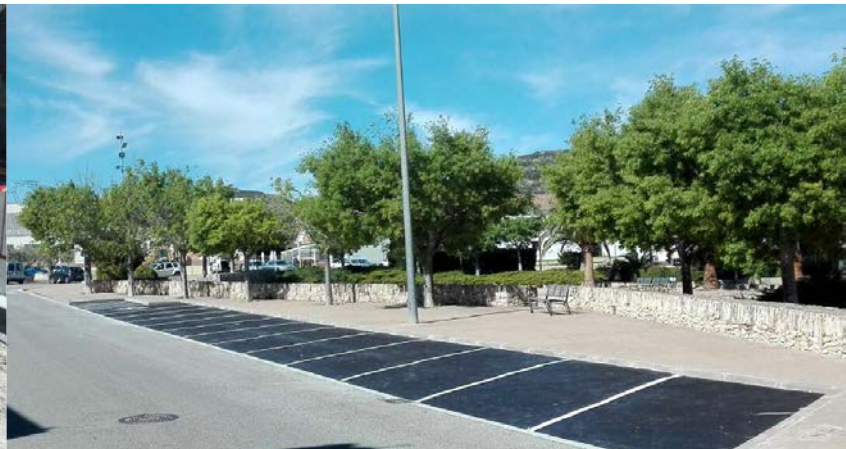
Formació de 12 aparcaments a la zona del Pla Firal

Canvi de canonades soterrades de distribució d'aigua potable de 515 metres lineals, renovació d'escomeses existents i instal·lació de dos vàlvules de comporta a l'avinguda Catalunya. Obres realitzades per un import de 50.118,19€ per l'empresa SOREA.