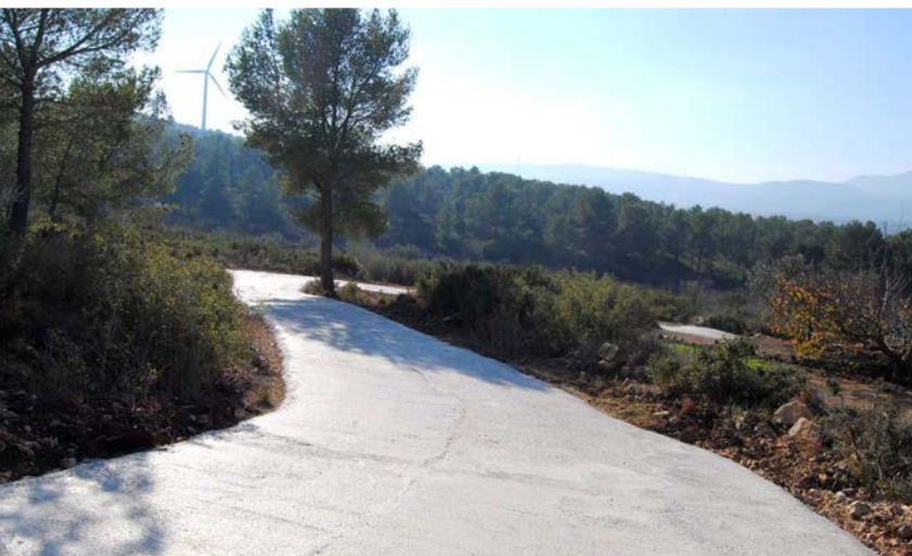
Camí del Corral Blanc

Import total 24.139,50€. Obres realitzades per l'empresa local Excavacions Labòria, SL.