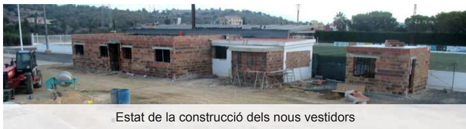
Estat de la construcció dels nous vestidors

Cost: 91.249,75 € Empresa adjudicatària: JOAN QUEROL I CURTO, SL