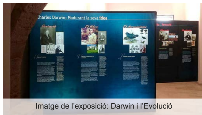
Imatge de l'exposició: Darwin i l'Evolució