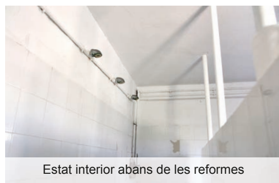
Estat interior abans de les reformes