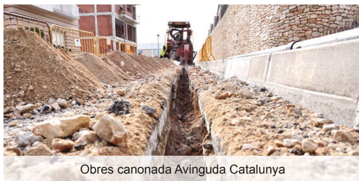
Obres canonada Avinguda Catalunya

Adquisició i instal·lació de 2 semàfors a l'avinguda Catalunya, 1 senyal pedagògica al Pont de la Tona i 4 senyals lluminoses "pas de vianants" a l'entorn del geriàtric i les escoles. Per un import de 21.500,01€. Proseñal, SL.