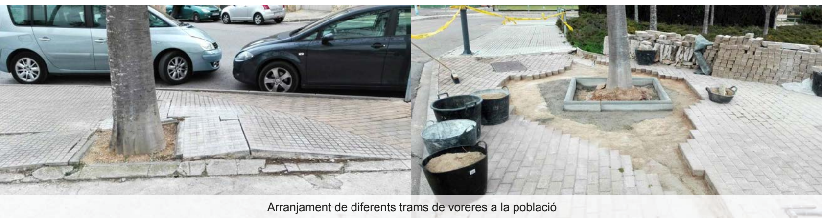
Arranament de diferents trams de voreres a la població

Millores i arranament de 540m2 de trams de voreres en mal estat al carrer Colom, Herois 8 de desembre, Perillós, Lluís Companys, Pla de la Fira, Torretes Noves, Avinguda Xiprers, Passeig de la Muralla, accés a l'Escola de Música. Import de 51.073,54€. Empresa local BEMAR 2008, SL.