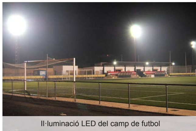
Il·luminació LED del camp de futbol