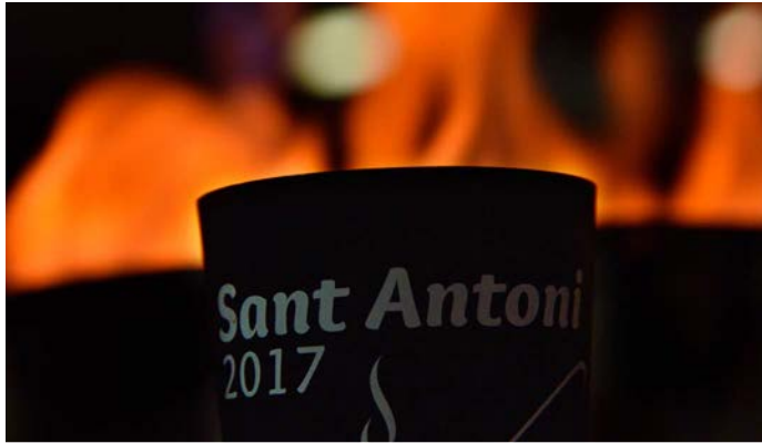
10è del CONCURS DE CALMANT

El Sant Antoni 2017 ha estat commemorat per diferents aniversaris d'alguns dels actes que s'organitzen: