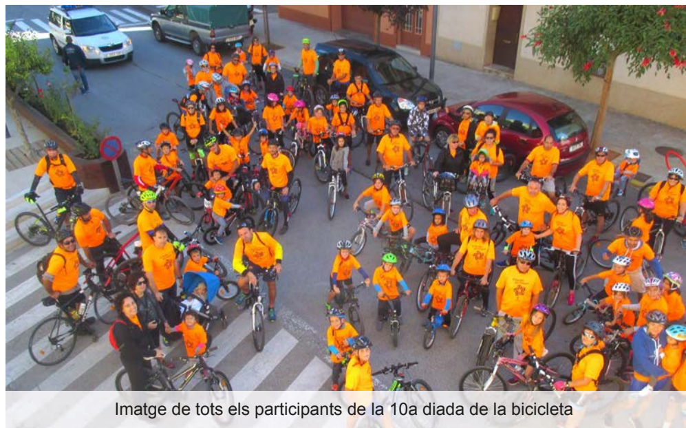
Imatge de tots els participants de la 10a diada de la bicicleta

Diumenge dia 17 de setembre es va acollir la 10a diada de la bicicleta. Hi va haver una bona participació de menuts, grans i famílies que va finalitzar amb un esmorzar al davant del pavelló poliesportiu municipal.