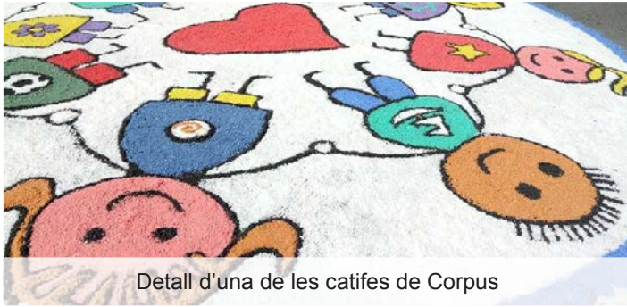
Detall d'una de les catifes de Corpus