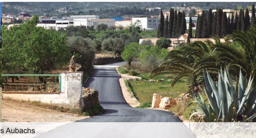
Camí dels Aubachs

Reforma de les cobertes 3 i 4 de la llar d'infants municipal amb nova formació de pendents i impermeabilització i canvi de la porta d'entrada per un import de 13.859,46€. Construccions Brull Brull, SL.