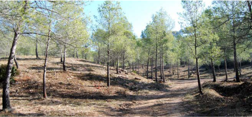
Camí dels Pradets