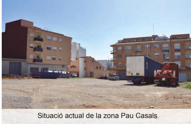
Situació actual de la zona Pau Casals