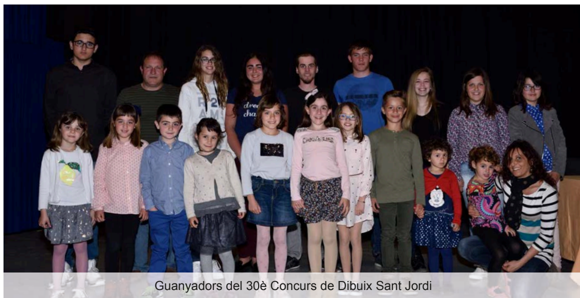
Guanyadors del 30è Concurs de Dibuix Sant Jordi