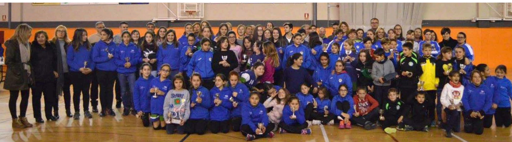
Imatge de tots els guardonats a la festa de l'esport 2016/17