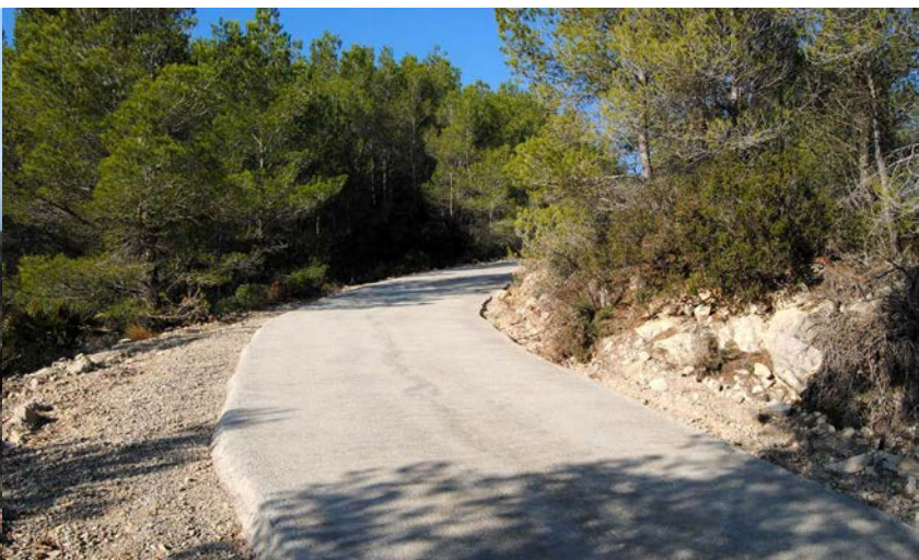
Camí de Tita-Portella