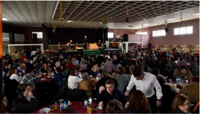
35è del CONCURS LITERARI