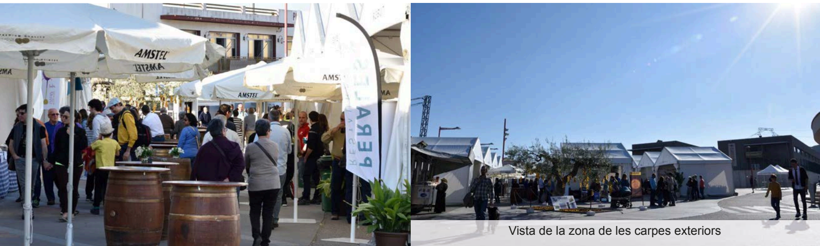
Vista de la zona de les carpes exteriors

Per segon any consecutiu, s'ha muntat la zona de carpes destinada als bars i restaurants del poble per tal d'oferir degustacions als visitants de la fira.