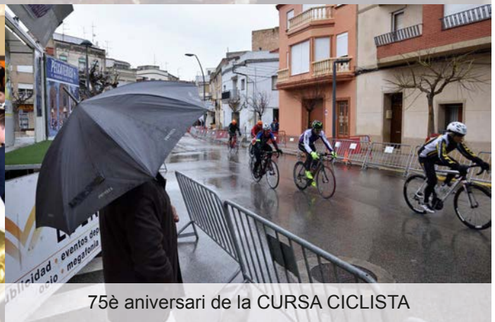
75è aniversari de la CURSA CICLISTA

Una de les novetats de la nostra festa major va ser la ballada de la jota del Perelló a càrrec de les damiselles, pubilla i quintos, el dia del nostre patró, Sant Antoni. Mesos abans, van assajar-la amb el mestre Maso Queralt i el grup de jotes del Perelló. Aquest acte tradicional es vol mantenir amb les diferents quintes que vagin venint.