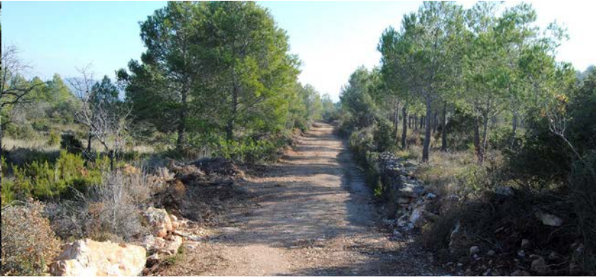
Camí de Betetes