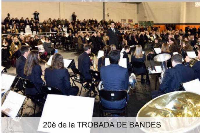
20è de la TROBADA DE BANDES