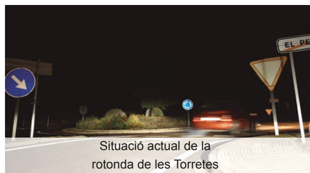
Situació actual de la rotonda de les Torretes

Lot 1, corresponent a la fase 1 del projecte per les obres d'enllumenat públic a l'accés al municipi des de la carretera TV-3022. Import: 39.117,80€ Lot 2, corresponent a la fase 3 del projecte per les obres d'enllumenat públic a l'accés al municipi des de la carretera N-340, sortida Perelló Sud. Import: 16.119,70€ Empresa adjudicatària dels 2 lots: Muntatges Lleida SA