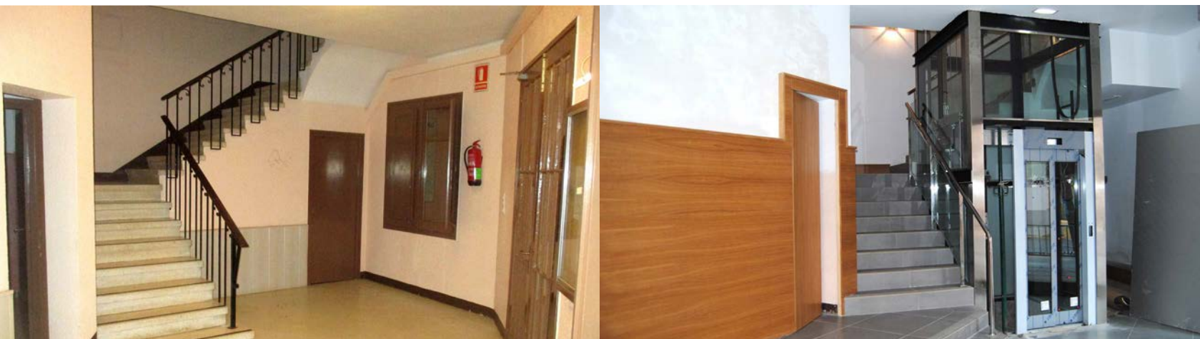
Abans i després de l'instal·lació de la'ascensor a l'Ajuntament

Cost: 86.032,79 € · Empresa adjudicatària: Construccions Jaén Vallés SL