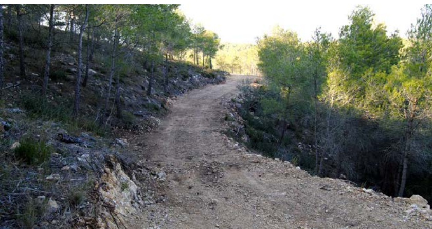
Camí Mas d'En Curto