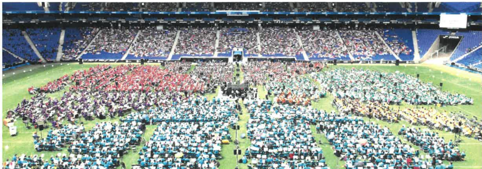
Concert del 25è aniversari de l'Associació d'Escoles de Música Municipals de Catalunya celebrat el passat juny al RCD Stadium de Cornellà al que va participar l'alumnat de l'escola de música.

L'Escola de Música Municipal realitza un taller d'una hora a la setmana per a famílies i infants per apropar la música als més petits i estimular el seu desenvolupament. El cost del taller és de 10€ al mes i es realitza els dimarts de 18.00 a 19.00h l'aula polivalent de la llar d'infants.