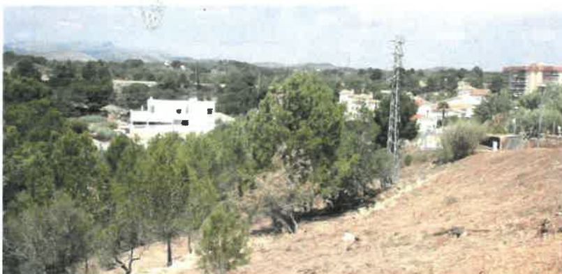
Perímetre netejat a la urbanització de Perelló Mar