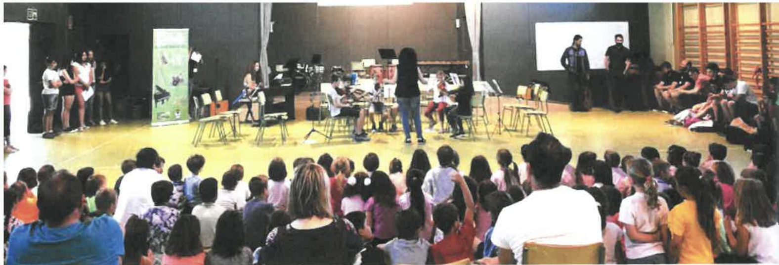
Concert del conjunt orquestral de l'escola de música a l'Escola Jaume II.