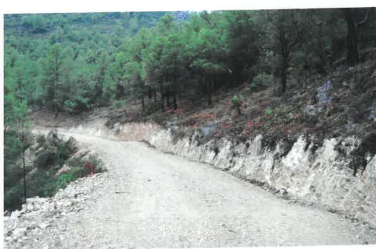
Camí dels Perxets

Cost de la inversió: 22.197,46€, finançada amb 18.345,01€ per la Generalitat de Catalunya. Empresa adjudicatària: EXCAVACIONS LABÒRIA, SL