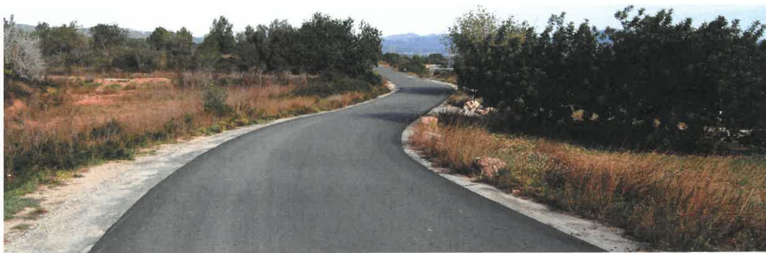
Camí de les Planes-Safranà

Empresa adjudicatària: EXCAVACIONS LABÒRIA, SL i RULL SERVEIS DE PINTURA I RETOLACIÓ.