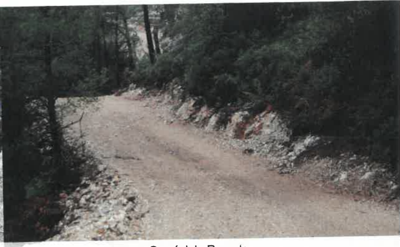
Camí dels Perxets

Aquesta actuació als Perxets s'ha complementat amb una inversió de 29.987,00€ subvencionats al 100% pel mateix programa de gestió forestal sostenible de la Generalitat de Catalunya a l'ADF Cabra Feixet i que han suposat 12,32 hectàrees d'obertura de franja per a prevenció d'incendis i 0.15 quilòmetres d'obertura de vial apte per a vehicles d'extinció d'incendis.