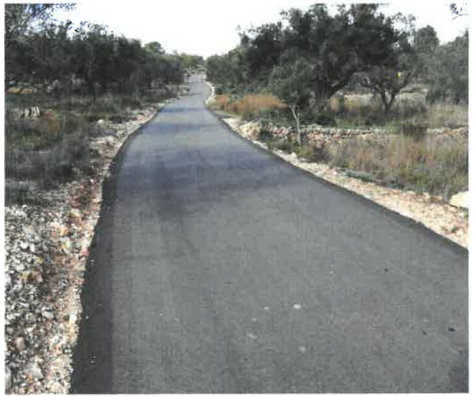
Camí de les Bordes

Empresa adjudicatària: EXCAVACIONS LABÒRIA, SL i RULL SERVEIS DE PINTURA I RETOLACIÓ.