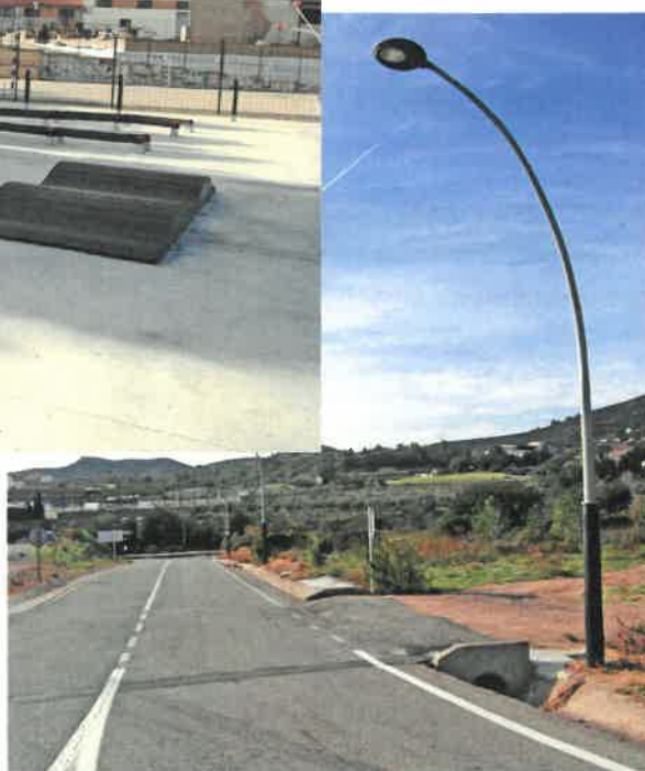
Entrada de les Torretes

Empresa adjudicatària: Muntatges Lleida SA