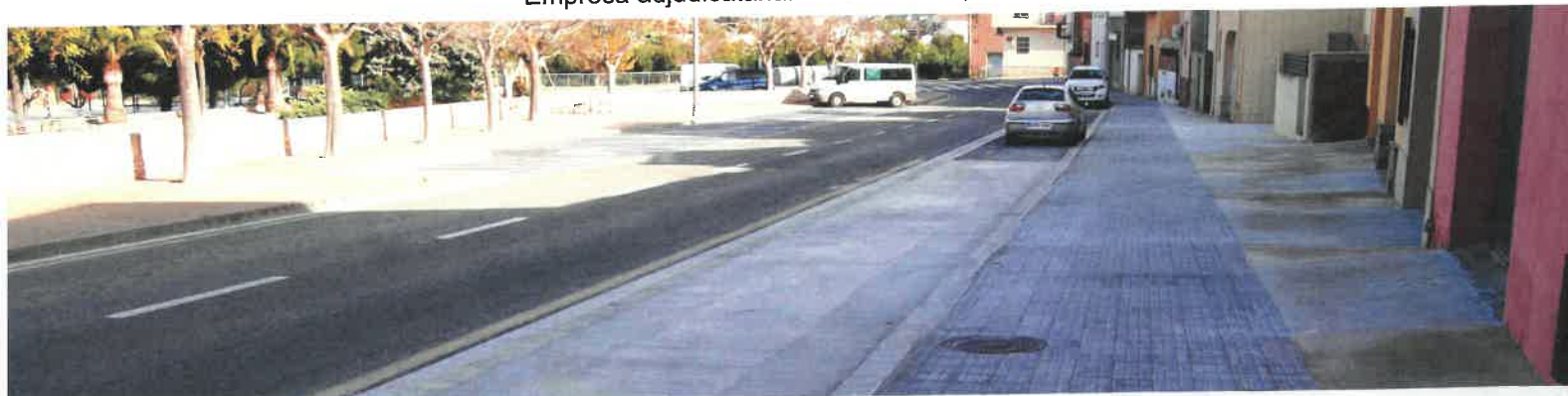
Vorera nova al carrer del Pla de la Fira.