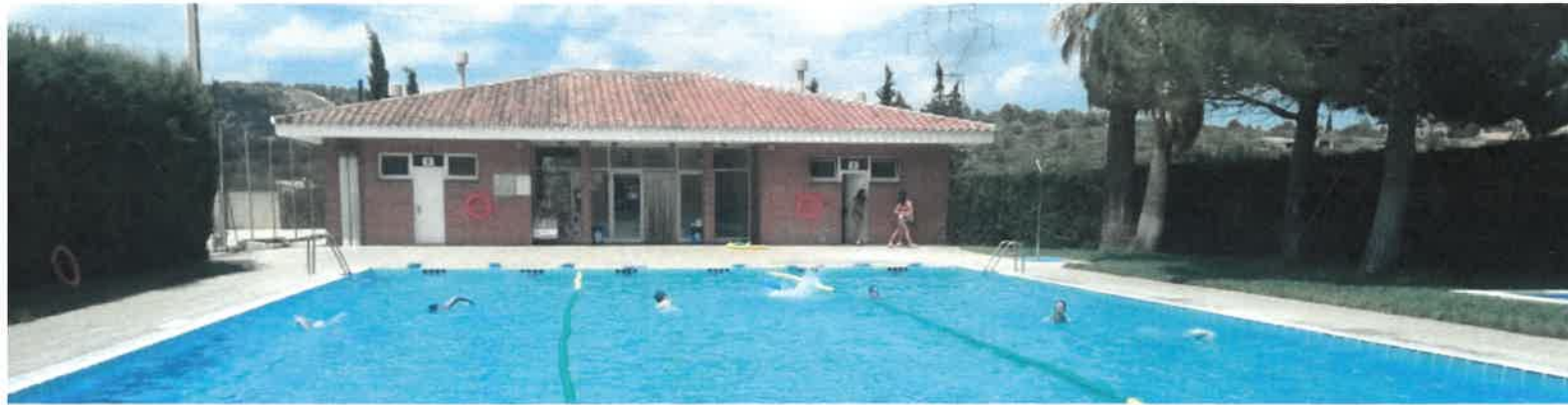
Cursos de natació adults.

La temporada d'estiu la piscina municipal va obrir portes del 2 de juliol al dia 31 d'agost. Participants del Casal d'Estiu de l'Ajuntament i els cursos de natació de menuts pels matins, va ser majoritàriament el públic en aquesta franja horària. Als migdies, cursos de natació d'adults amb molt bona acceptació. Per les tardes, famílies, joves i menuts... tots a l'aigua per ajudar a combatre les altes temperatures.